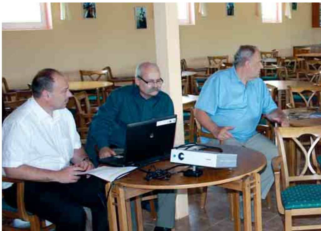
Tématický seminář na Hipodromu v Mostě.

Nutno rozlišovat nutnou obranu s použitím střelné zbraně na straně obránce s institutem oprávněné použití zbraně podle § 32 trestního zákoníku. Tento se týká výhradně příslušníků ozbrojených složek, bezpečnostních sborů a ně-