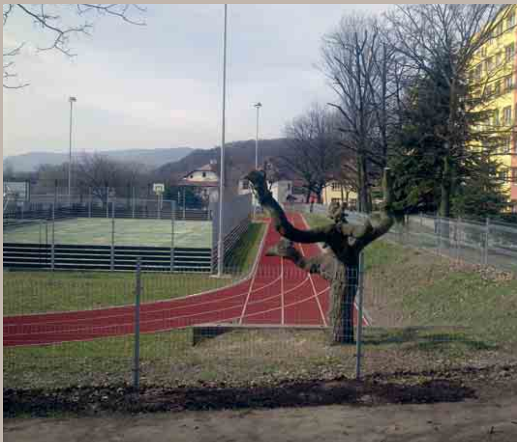
Školní hřiště ZŠ Šafaříkova ul. Litvínov