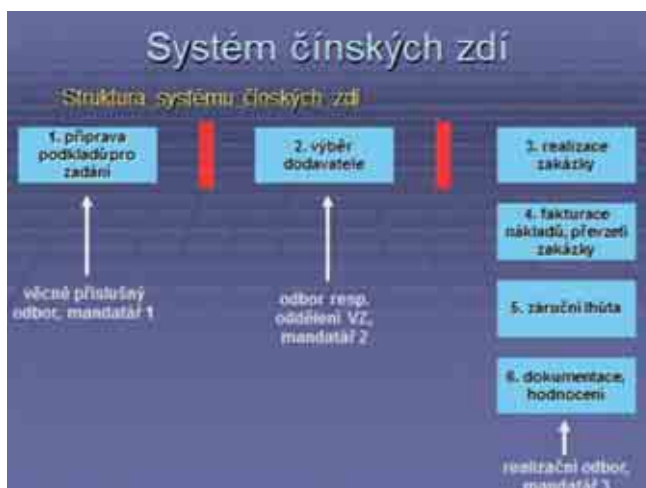
Obr. 1 – Struktura systému čínských zdí – statutární město Most