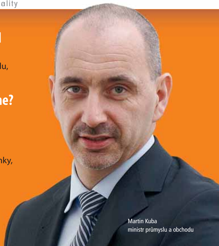
Martin Kuba ministr průmyslu a obchodu