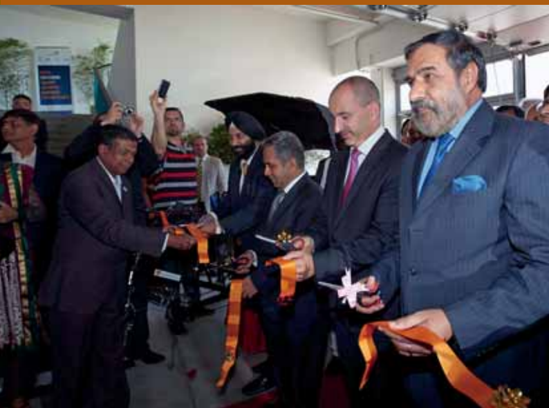
Otevření indické expozice na MSV, ministr průmyslu a obchodu ČR Martin Kuba a ministr průmyslu a obchodu Indie Anand Sharma.

ci našeho konzulátu. Obávám se, že velké řadě již realizovaných formátů česko-saské spolupráce se nedostává dostatečné medializace a zůstává nevyužita, vyplnění této mezery má právě napomoci již zmíněný seriál exportních seminářů, podobný problém malé znalosti a povědomí podnikatelů o možnostech účasti v řadě programů vnímáme ale i v jiných krajích a regionech. Doporučuji vašim čtenářům bedlivě prozkoumat nabídku, která se objevuje např. na webových stránkách ministerstva a dalších tam uvedených odkazech, namátkou ještě www.businessinfo.cz .