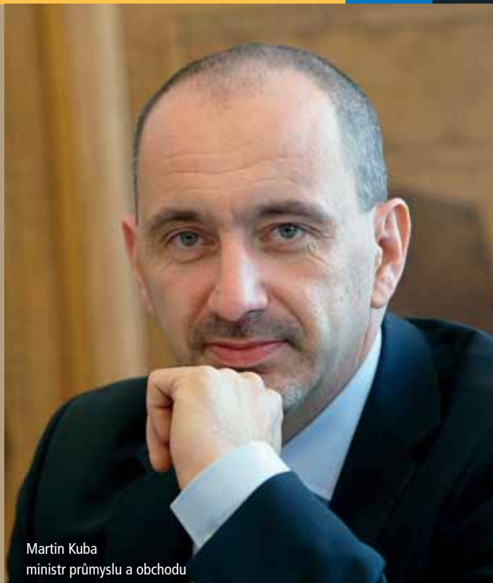
Martin Kuba ministr průmyslu a obchodu