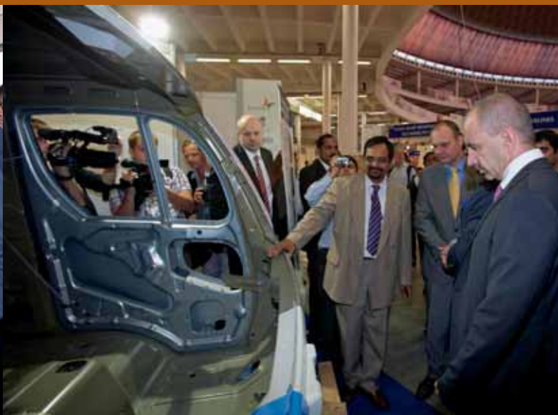
Ministr Kuba při prohlídce expozic v areálu MSV Brno 2012.