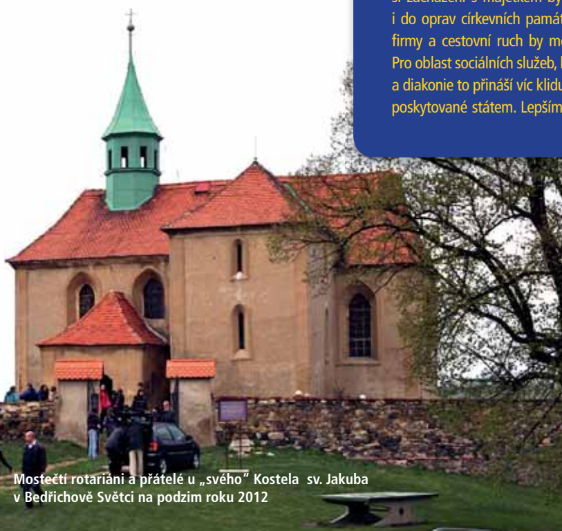
Mostečtí rotariáni a přátelé u „svěho“ Kostela sv. Jakuba v Bedřichově Světcí na podzim roku 2012