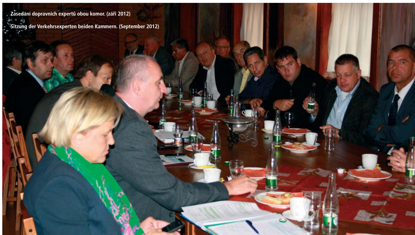
Sitzung der Verkehrsexperten beider Kammern. (September 2012)