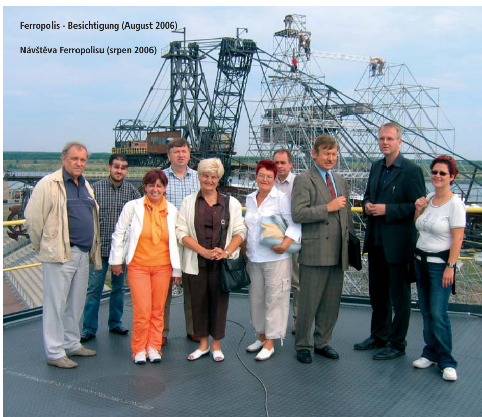
Návštěva Ferropolisu (srpen 2006)