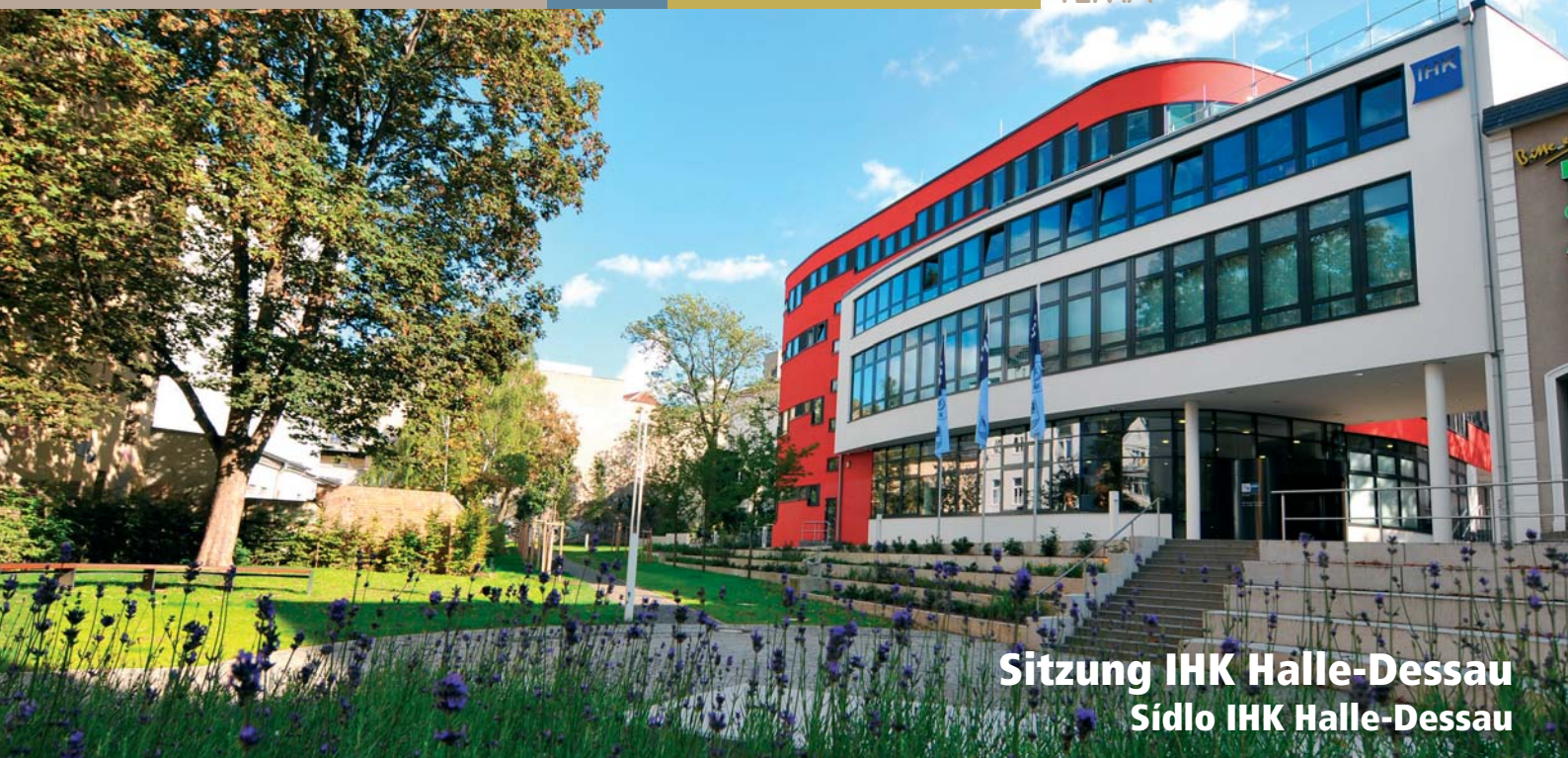
Sitzung IHK Halle-Dessau Sídlo IHK Halle-Dessau