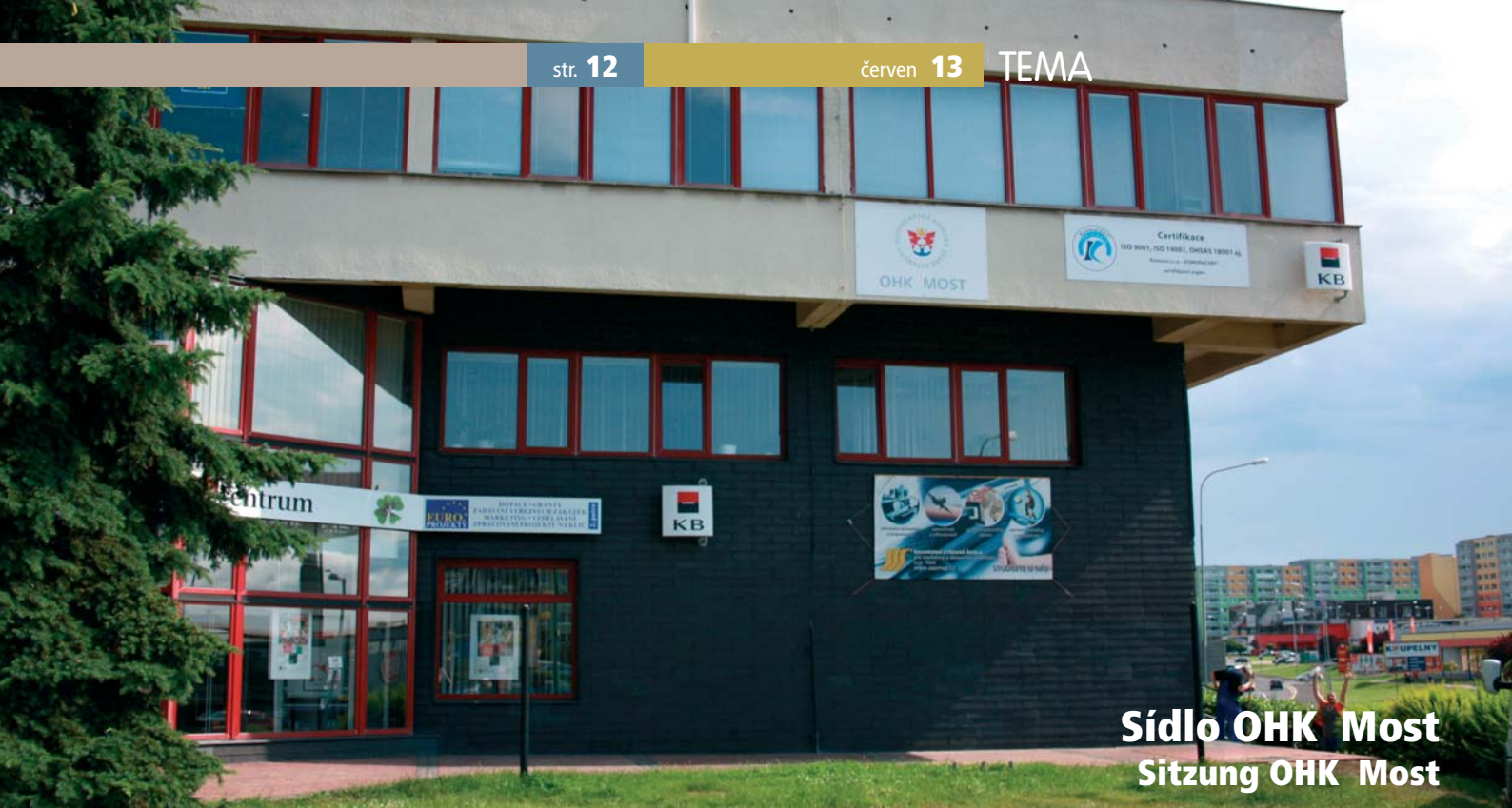
Sídlo OHK Most Sitzung OHK Most