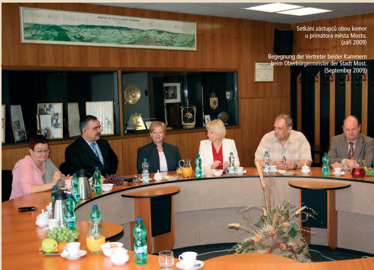
Setkání zástupců obou komor u primátora města Mostu. (září 2009)