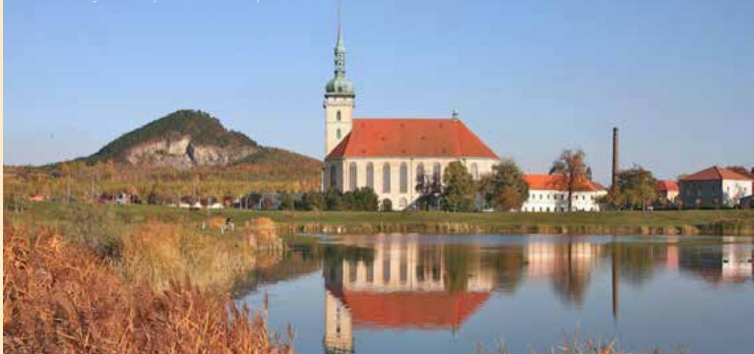
Foto z Ústeckého regionu: Děkaný kostel Nanebevzetí Panny Marie v Mostě