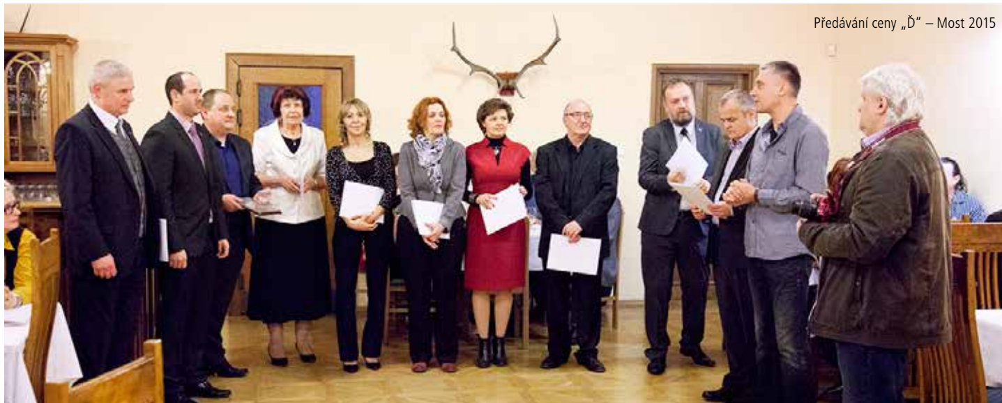
Předávání ceny „Ď“ – Most 2015

U řady sbírek má člověk oprávněný pocit, že se hlává stát se svými povinnostmi. Není to snad tak, že odpovědní pracovníci, kteří se mají starat o zdroje, jaksi počítají s tímto způsobem doplňování prostředků. Nestává se potom z dobré vůle forma dobrovolné daně? Skutečně jsme tak ekonomicky slabým státem, že musíme doplňovat chybějící prostředky doprošováním se spoluobčanů? Neměli bychom konečně přestat dělat nejrůznější experimenty typu tunel Blanka, Opendcard či softwarů pro státní správu nebo Izipů? Kdy už konečně někdo pochopí, že státní prostředky neslouží k neohospodárnému a často bezmyšlenkovitému rozházení, se záměrem najít způsob, jak přilepšit sobě, svým kamarádům