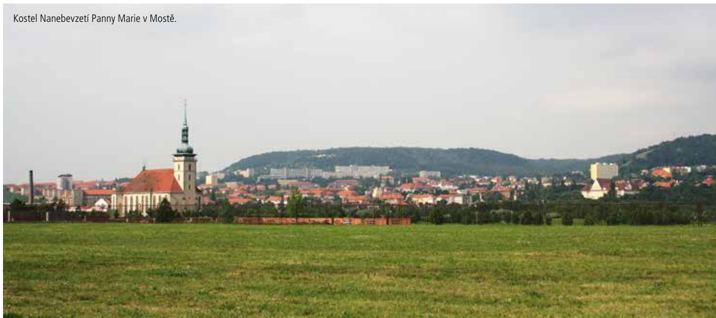
Kostel Nanebevzetí Panny Marie v Mostě.