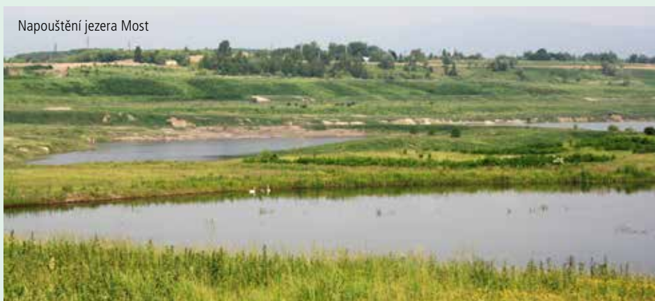
Napouštění jezera Most