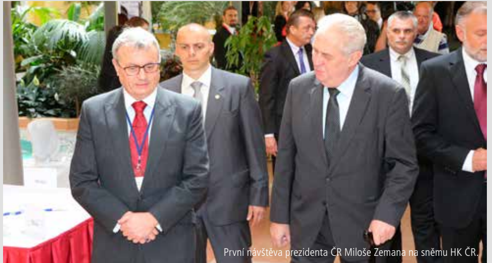
První návštěva prezidenta ČR Miloše Zemana na sněmu HK ČR.

Navrhujeme, aby vláda v návrhu rozpočtu na rok 2016 výrazně snížila strukturální deficit.