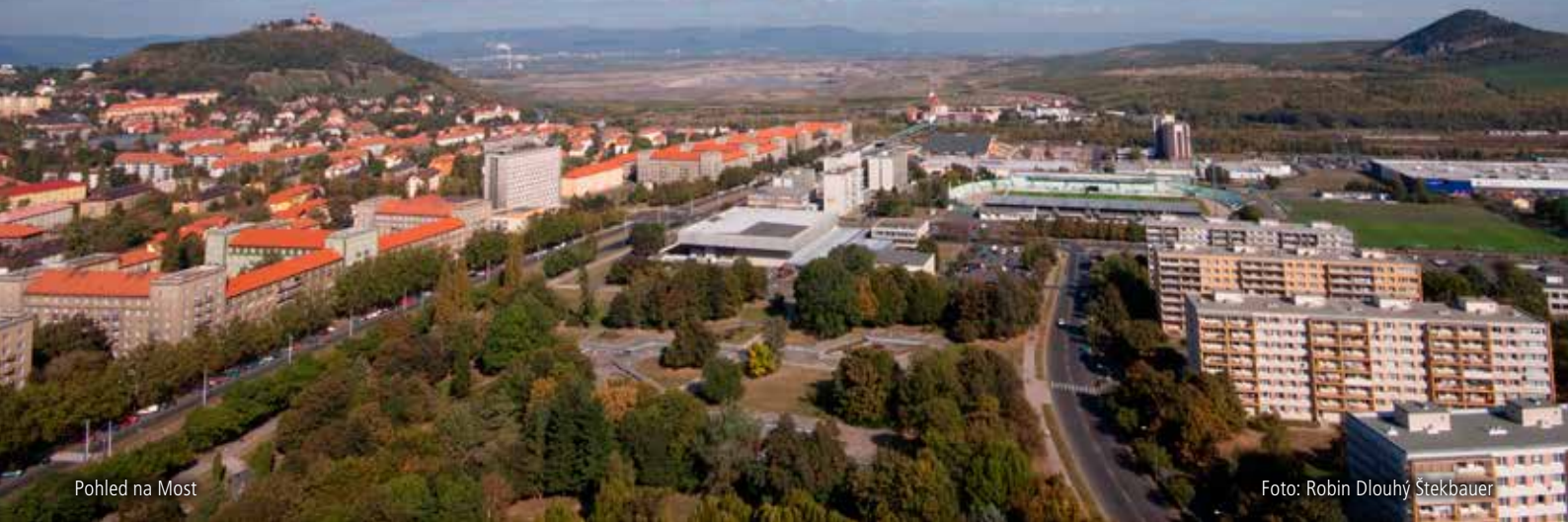
Pohled na Most