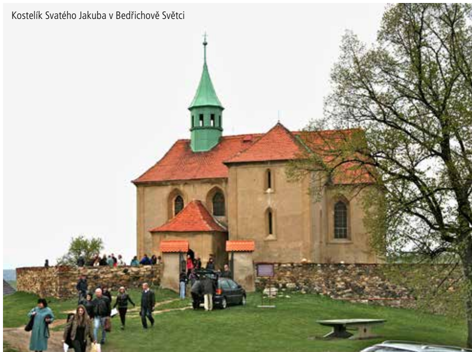
Kostelík Svatého Jakuba v Bedřichově Světcí