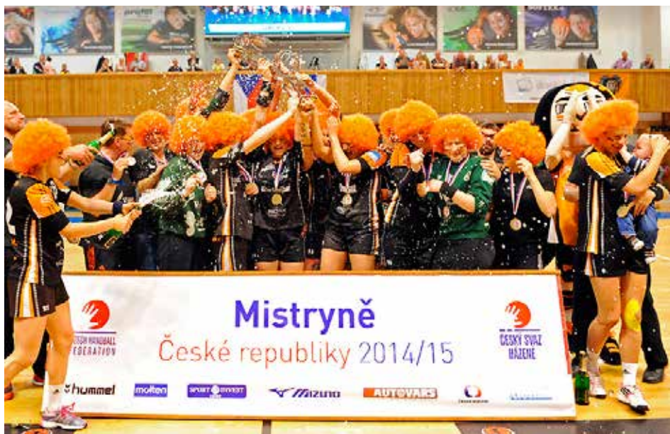
Mostecké házenkářky jako Černí andělé po druhém místě v Interlize WHIL jako nejlepší Český tým a získáním Českého poháru, uzavřeli letošní zlato-stříbrnou sezonu obhájením mistrovského titulu ČR a to již po třetí za sebou.