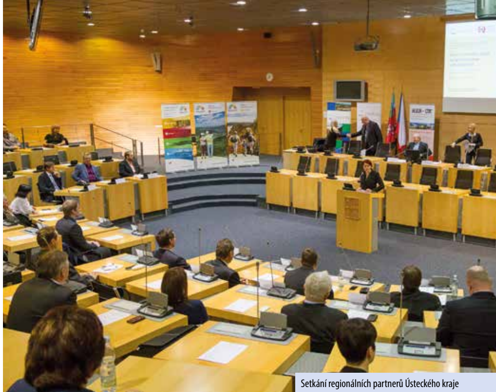
Setkání regionálních partnerů Ústeckého kraje