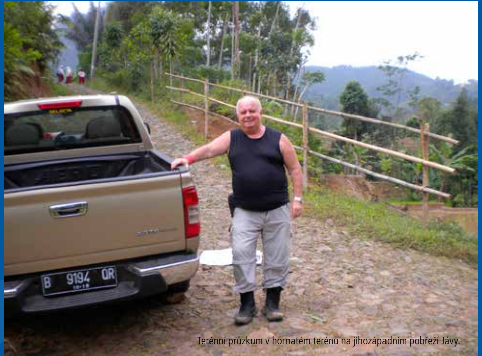
Terénní průzkum v hornatém terénu na jihozápadním pobřeží Jávy.

Německo – paní Merkelová se dopustila další historické chyby, která oslabuje a rozděluje Evropu. Když pozvala miliony uprchlíků do Německa, ani si neuvědomila, že tito lidé nemají křídla a že se do Německa musí dostat přes území jiných zemí, zemí chudších než Německo, zemí, které nejsou jak ekonomicky, tak politicky a bezpečnostně připraveny na statisíce či miliony běženců. Lidé, kteří utíkají před válkou a násilím, musíme litovat, ale o jejich bezpečnost se měla postarat mezinárodní komunita v čele s EU a vytvořit bezpečnostní zóny na hranicích zemí postižených konfliktem, systematicky investovat a vytvořit místní podmínky pro zaměstnání a podmínky pro návrat