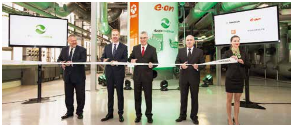
Slavnostní prozvoznění elektrokotle ve ŠKO-ENERGO se uskutečnilo 4. listopadu 2016 za účasti vrcholných představitelů společností ŠKODA AUTO, E.ON Česká republika a vedení ŠKO-ENERGO.

Skládání nebo akumulace energie je dlouhodobě zásadním tématem v oblasti energetiky. Proto byl ve ŠKO-ENERGO realizován inovativní